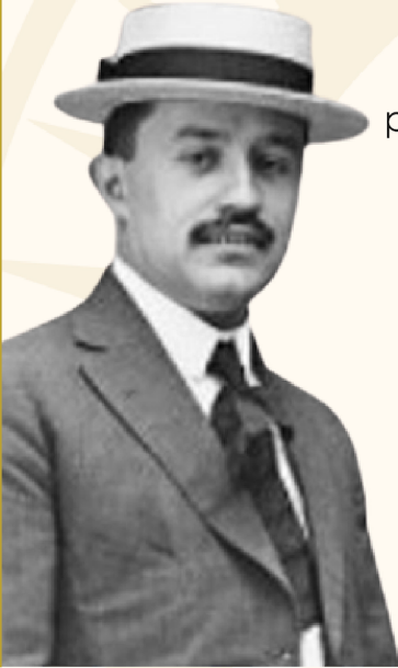
José Vasconcelos Calderón

Nació en Oaxaca, el 27 de febrero de 1882. Además de ser maestro fue un importante funcionario público, político y pensador mexicano. También, fue el fundador del Ministerio de Educación en México, y fue cuando comenzó con una importante labor que lo dio a conocer como el maestro de la juventud en América.